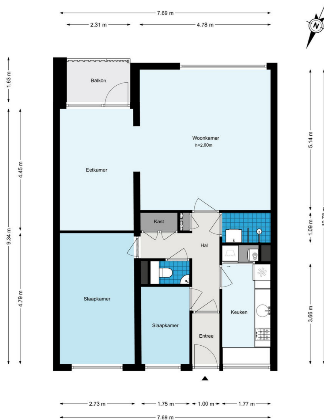
Van Godewijkstraat 247 - Hendrik-Ido-Ambacht Appartement

De plattegronden zijn geproduceerd voor promotionele doeleinden en ter indicatie. Aan de plattegronden kunnen geen rechten worden ontleend.