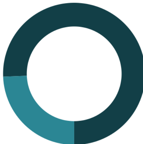
Koop / huur