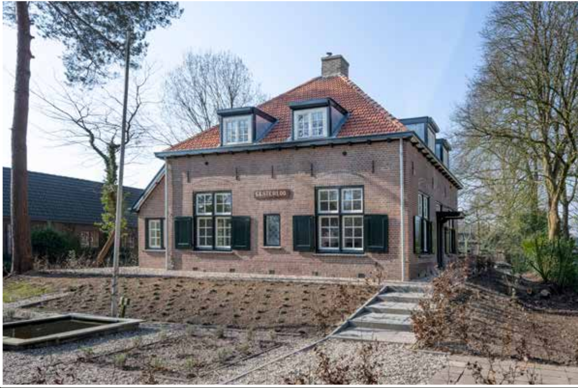
Gorsse Zutphenseweg 24