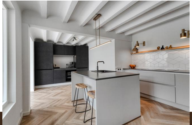
Zand- en Jaagpad 37 Baambrugge