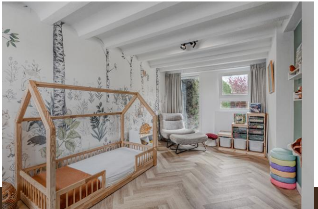
Zand- en Jaagpad 37 Baambrugge