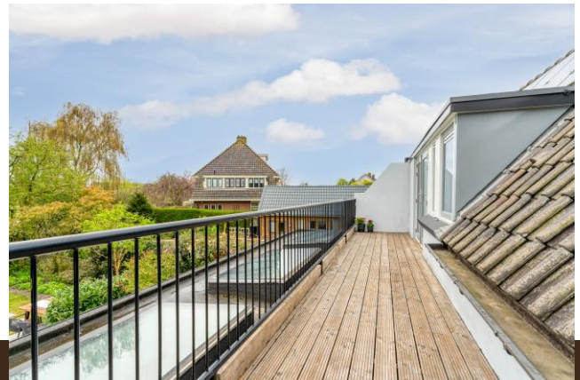
Zand- en Jaagpad 37 Baambrugge