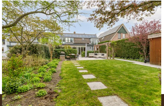
Zand- en Jaagpad 37 Baambrugge