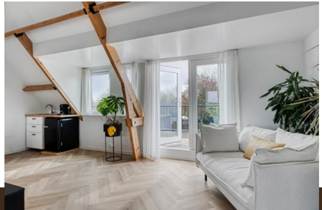
Zand- en Jaagpad 37 Baambrugge