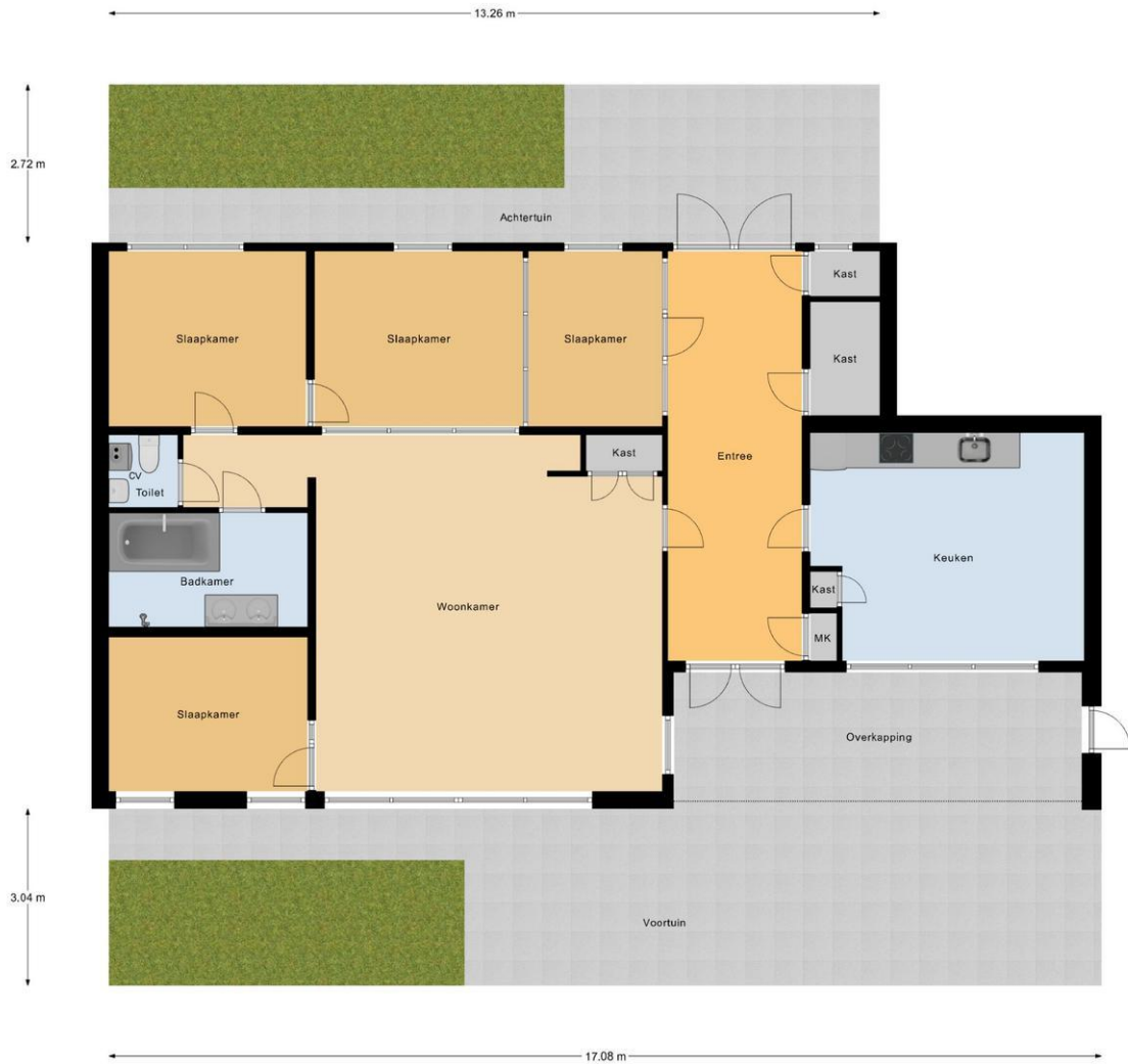
Begane Grond Tuin