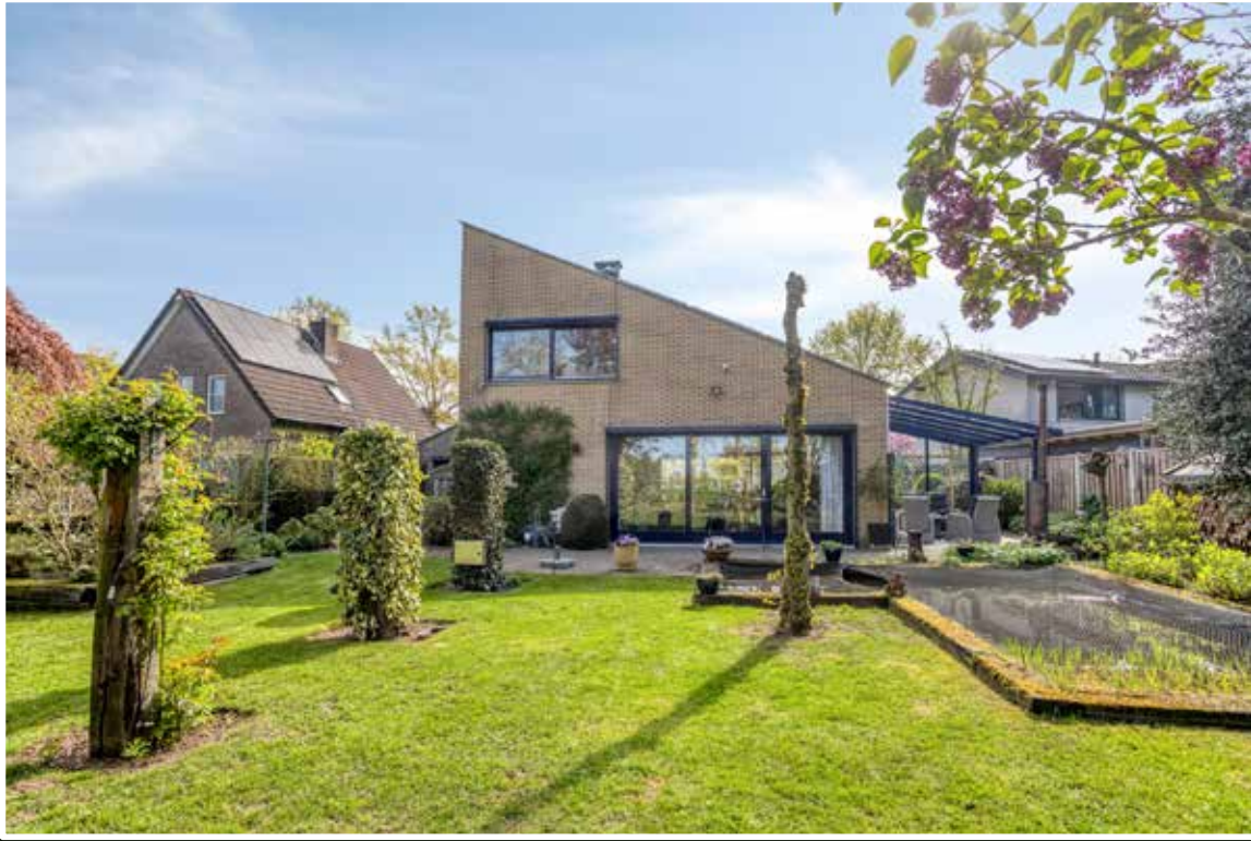
Eerbeek Kraaiheide 86