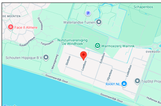
noorden kadastrale kaart