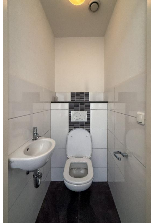
Bijkeuken | Toilet | Balkon