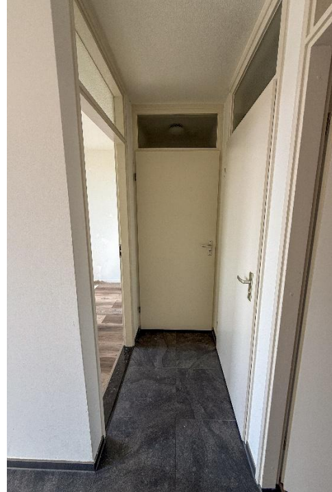
Hal | Woonkamer