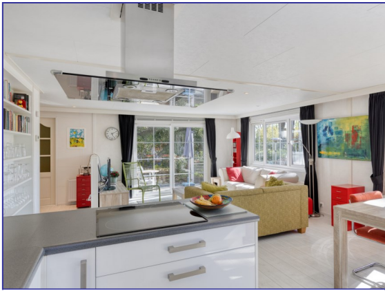
KEUKEN / WOONKAMER