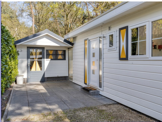
ENTREE / BERGING