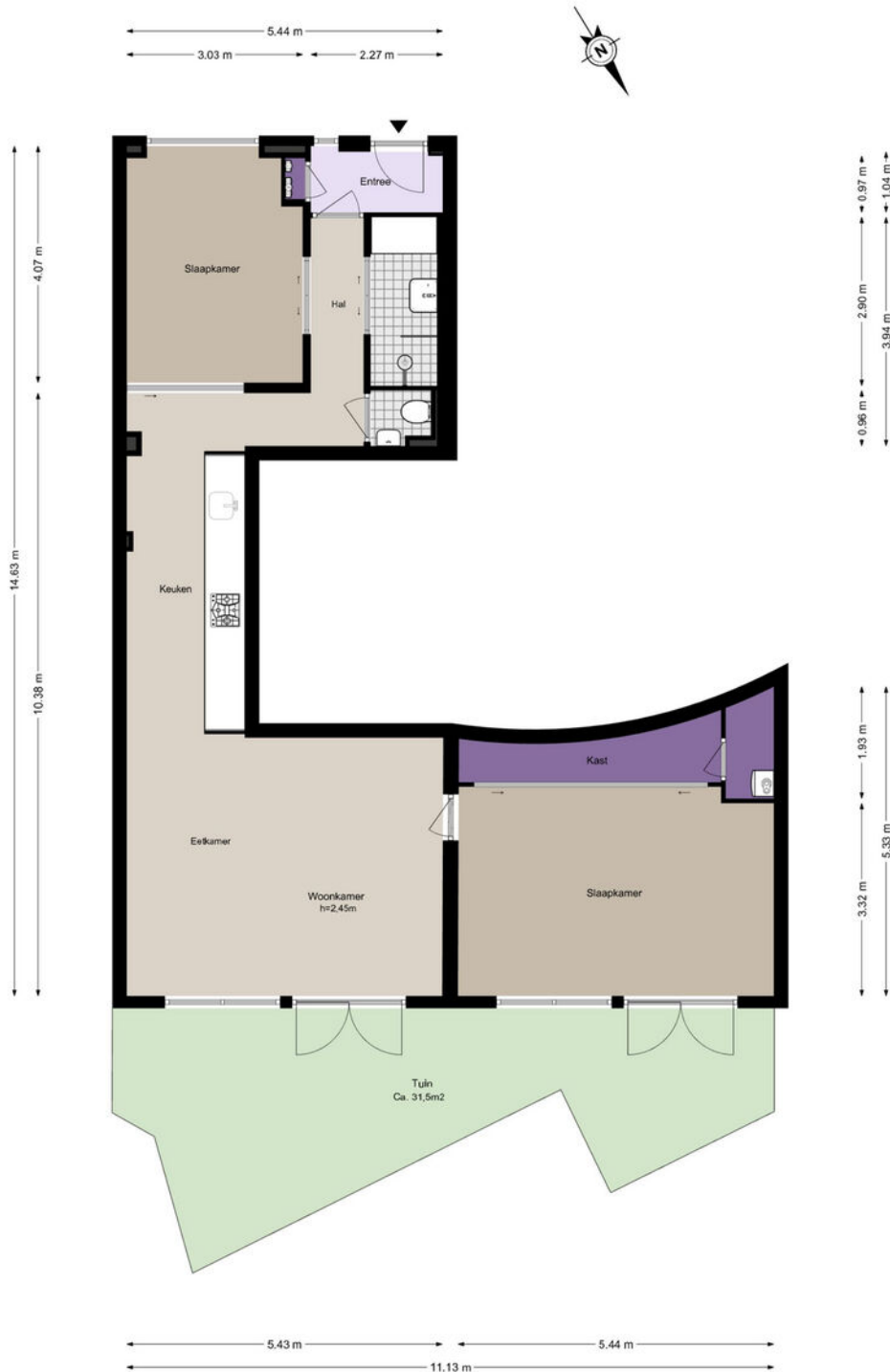
Borneostraat 1-B - Amsterdam Begane grond

De plattegronden zijn geproduceerd voor promotionele doeleinden en ter indicatie. Aan de plattegronden kunnen geen rechten worden ontleend. © www.woningmedia.nl