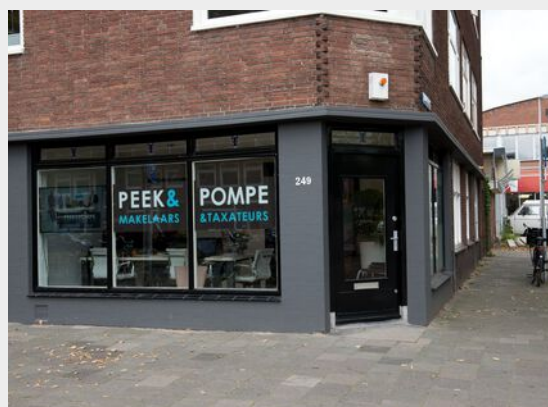
Kantoor Utrecht - Centrum Croeselaan 249 Utrecht

Wij zijn dagelijks actief vanuit Utrecht, Leidsche Rijn en Maarsse.