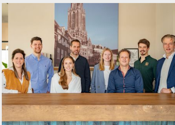
Kantoor Utrecht - Leidsche Rijn Willem Frederik Hermansstraat 698 Utrecht

Graag leiden we je rond door de woning en voorzien wij je van alle nodige informatie. Mocht er iets ontbreken, laat het ons weten. Zorg dat je tijdig een afspraak plant en het is aan te raden je eigen aankoopmakelaar in te schakelen.