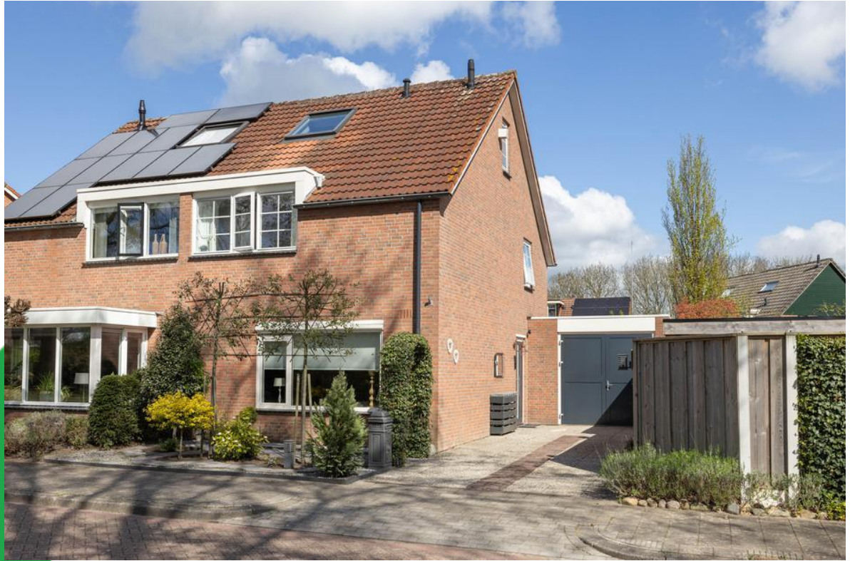
Cruys Voorberghstraat 168, 7558 WP Hengelo