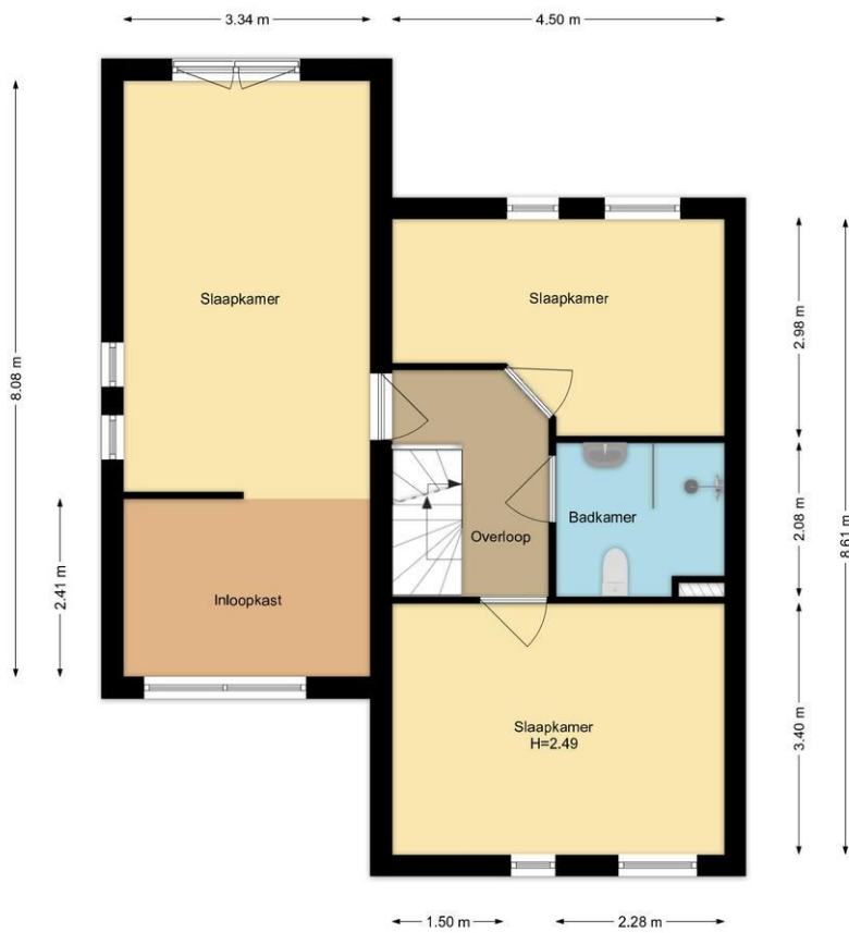
1e Verdieping Seevank 218, Zwanenburg

R.M. Vastgoedpresentatie.nl. Aan deze plattegrond kunnen geen rechten worden ontleend.