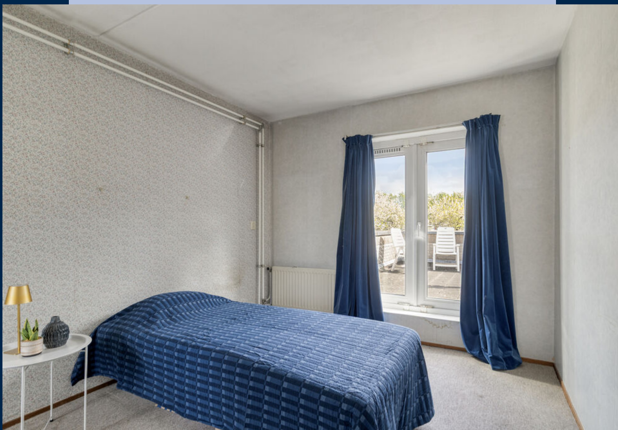
Op de eerste verdieping bevinden zich twee goed bemeeten slaapkamers.