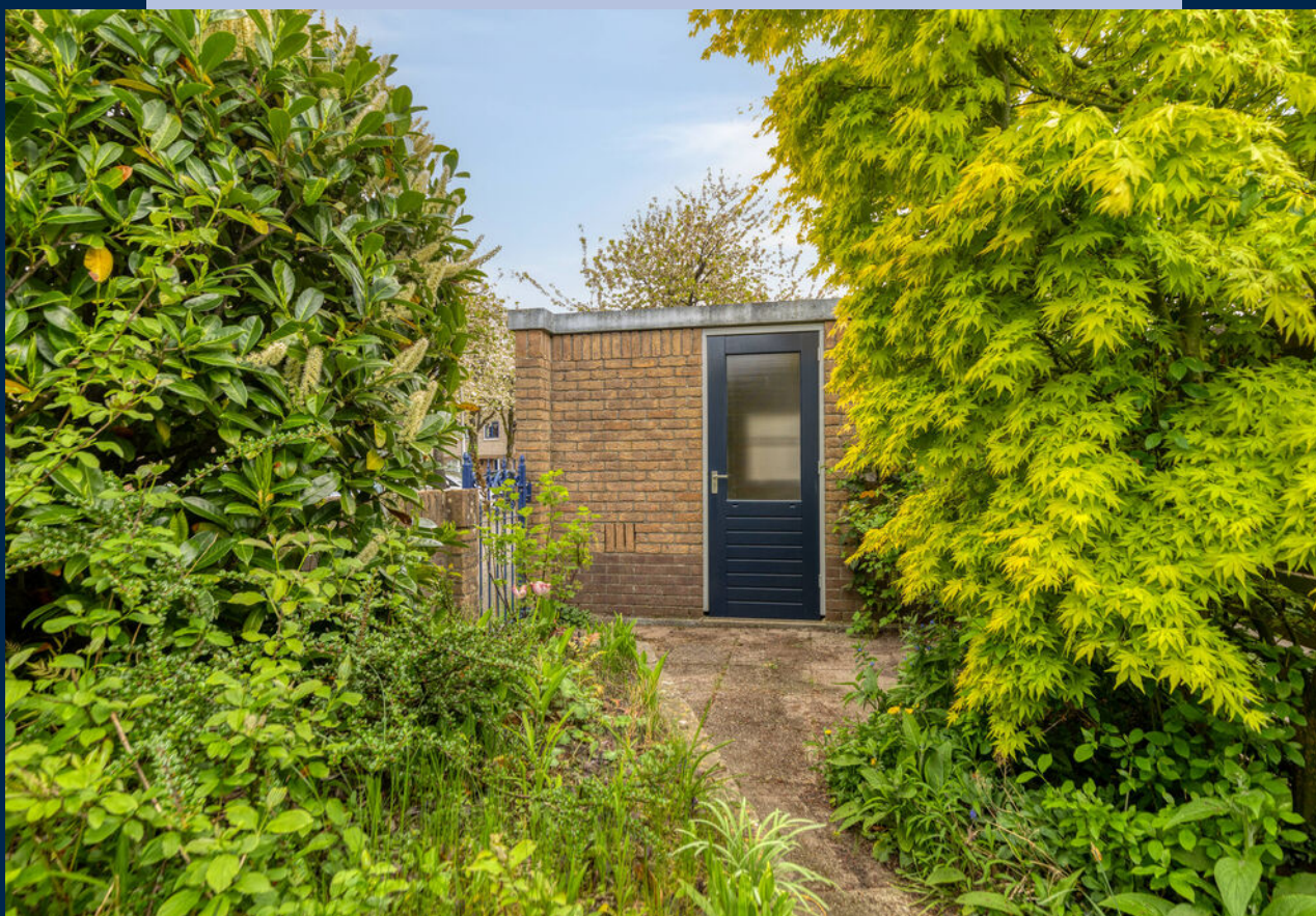
Achterin de tuin staat een stenen berging.