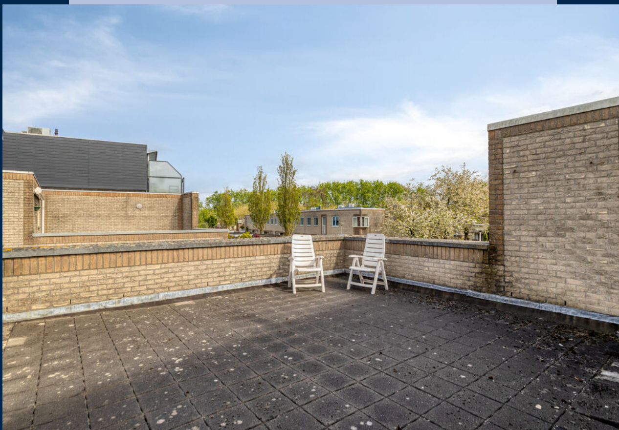
Eén van de slaapkamers geeft middels openslaande deuren toegang tot een royaal dakterras gelegen op het zuiden.