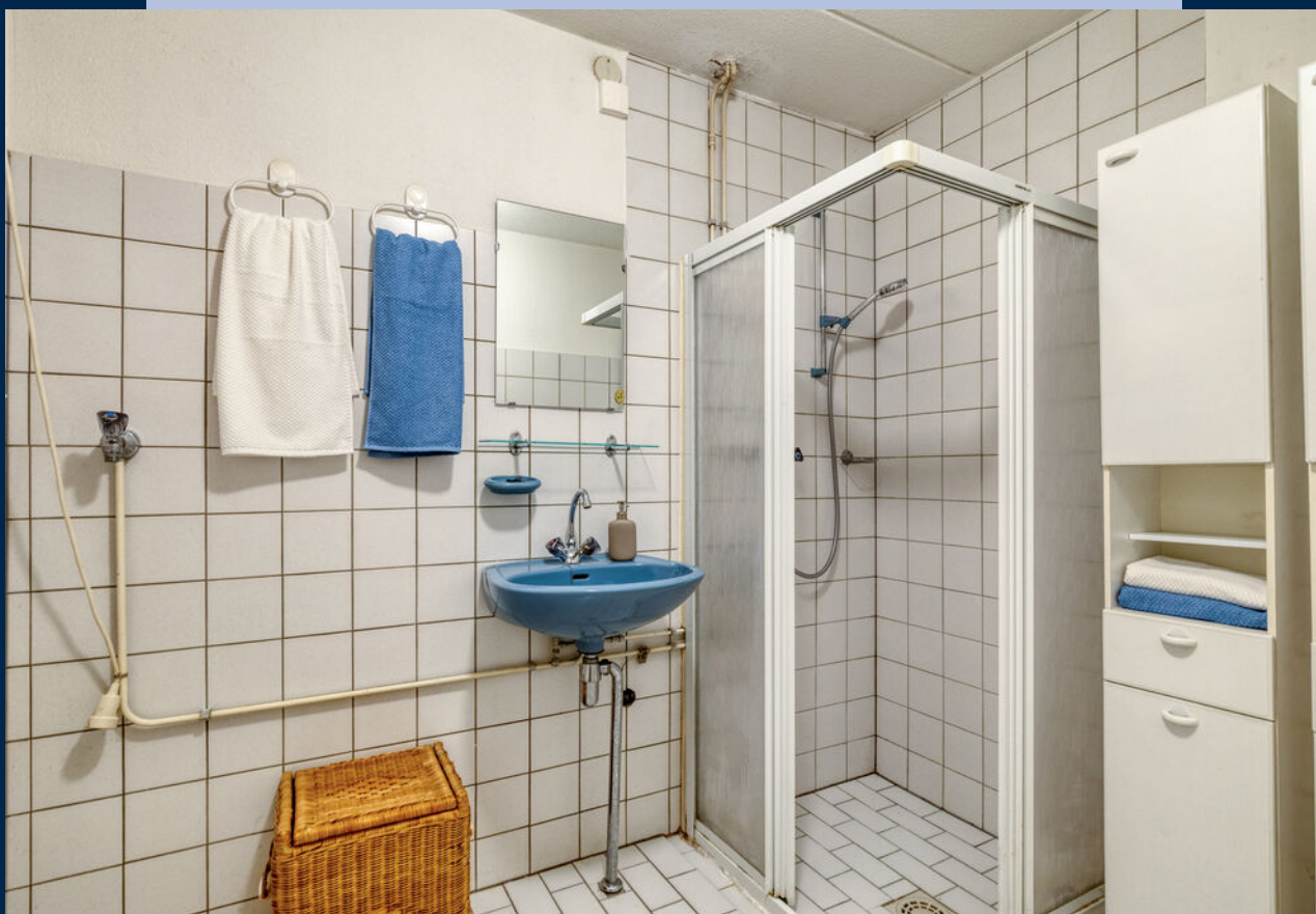
De badkamer is voorzien van een douche, wastafel en aansluiting wasapparatuur.