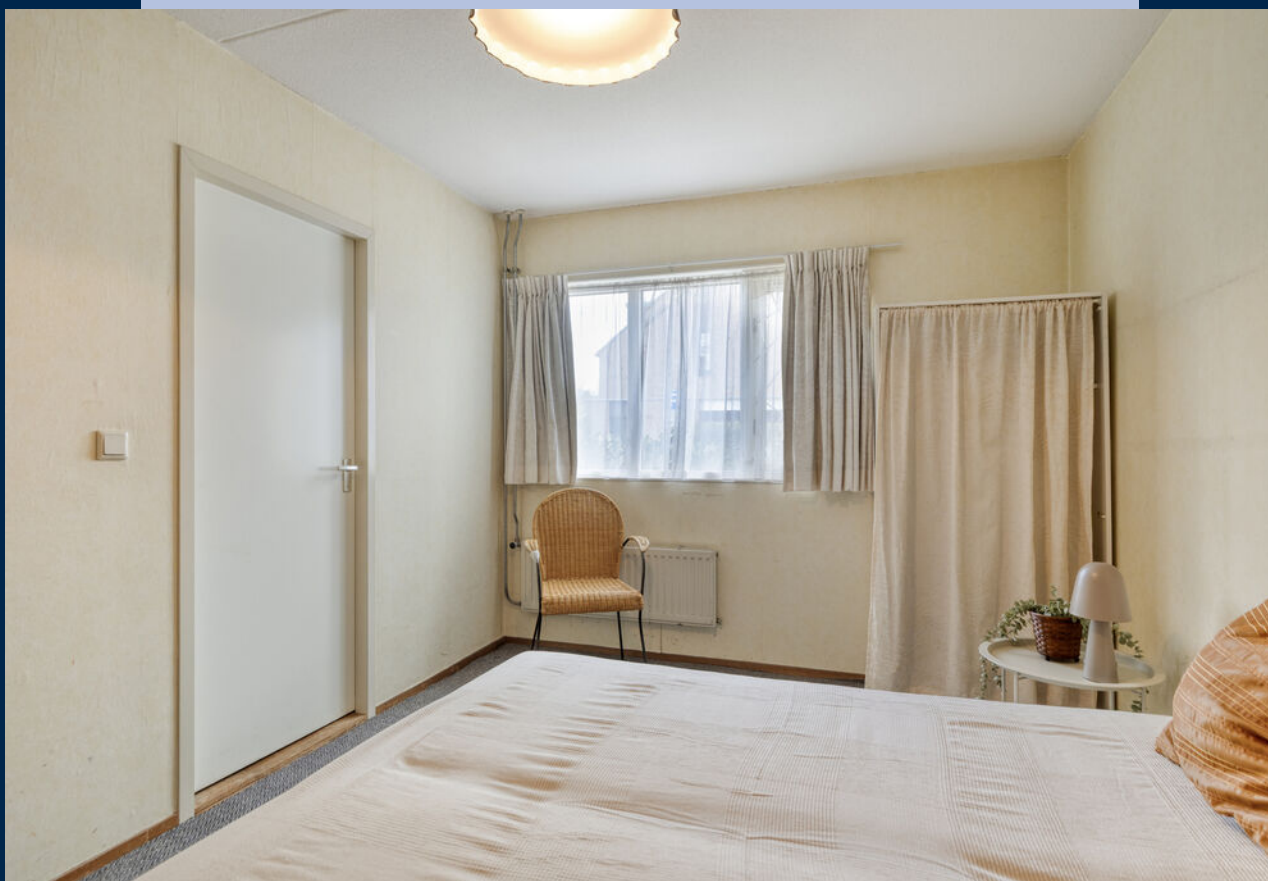
Op de begane grond bevinden zich tevens een slaapkamer en een badkamer.