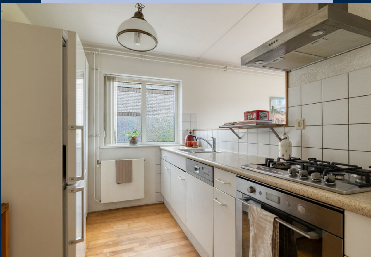
De half open keuken is voorzien van diverse inbouwapparatuur.