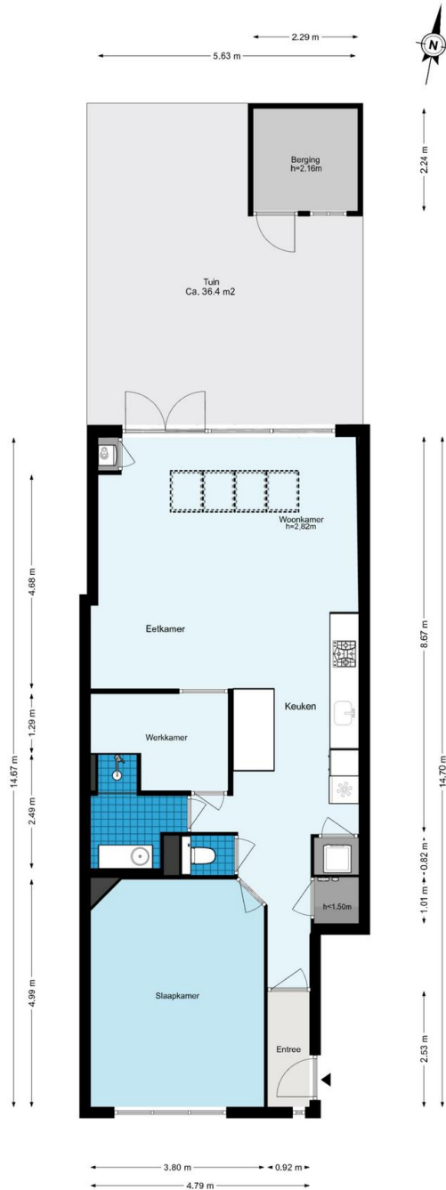
Argonautenstraat 88-H - Amsterdam Begane grond

De plattegronden zijn geproduceerd voor promotionele doeleinden en ter indicatie. Aan de plattegronden kunnen geen rechten worden ontleend.