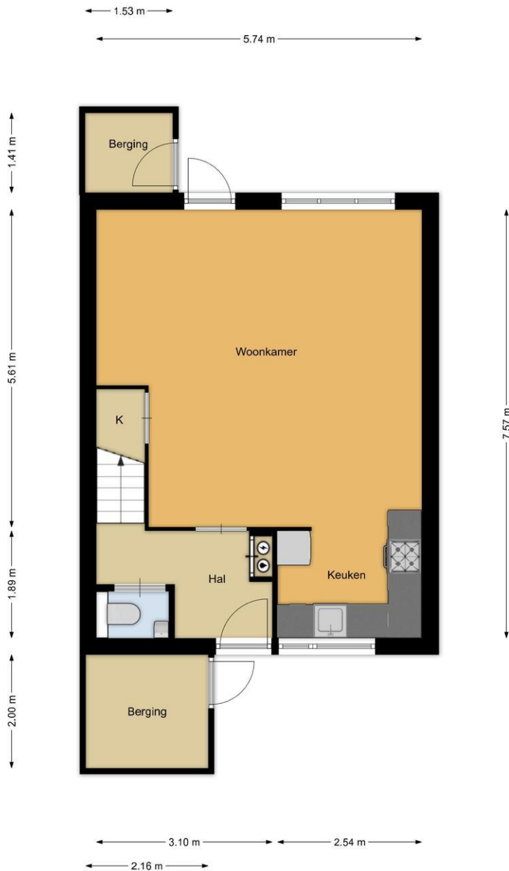
Delta 24, Huizen Begane grond

De plattegronden zijn geproduceerd voor promotionele doeleinden en ter indicatie. Aan de plattegronden kunnen geen rechten worden ontleend.