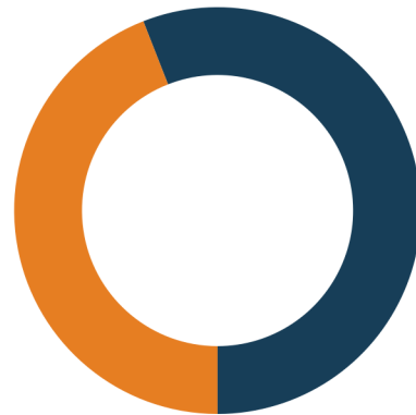
Koop / huur