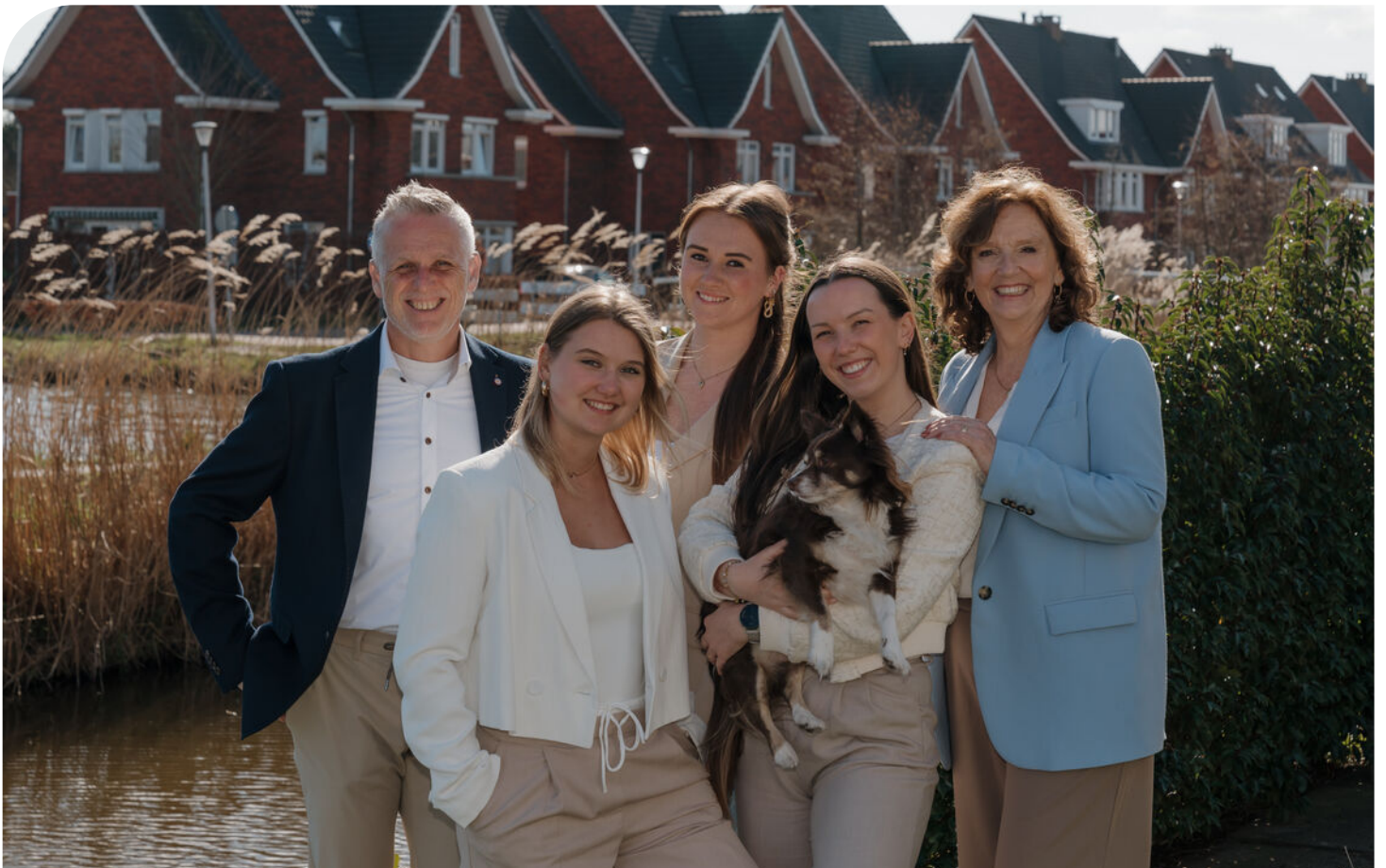
Team Flaton Makelaars Taxateurs