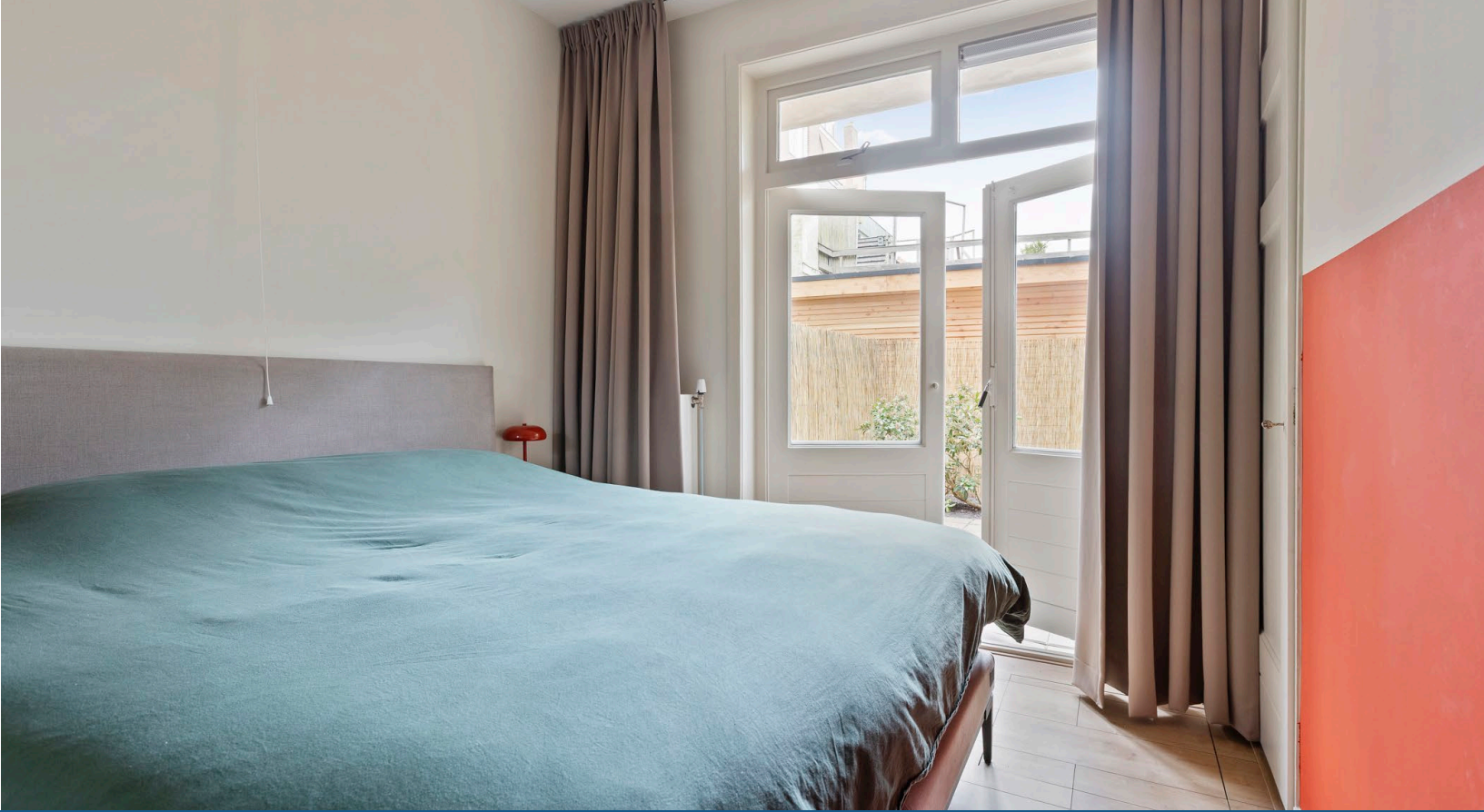
De slaapkamer met wastafel en met openslaande deuren naar de tuin ligt rustig aan de achterzijde van de woning.