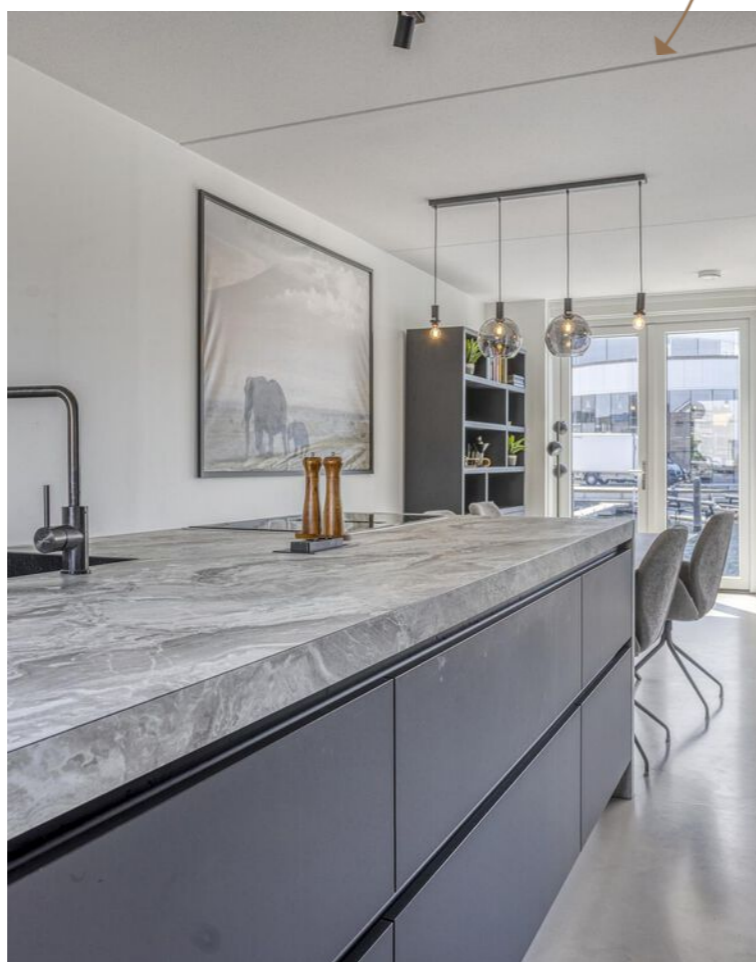
Luxe open keuken

De aangrenzende berging biedt extra opbergruimte, een gootsteen én plek voor fietsen.