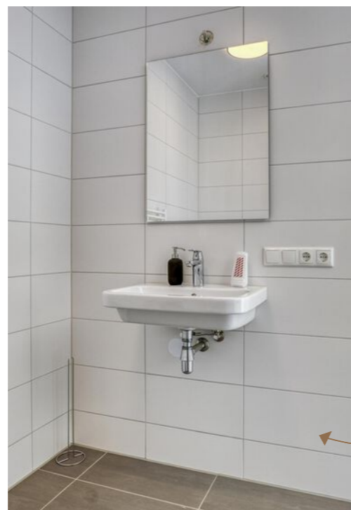
Tweede badkamer op de tweede verdieping