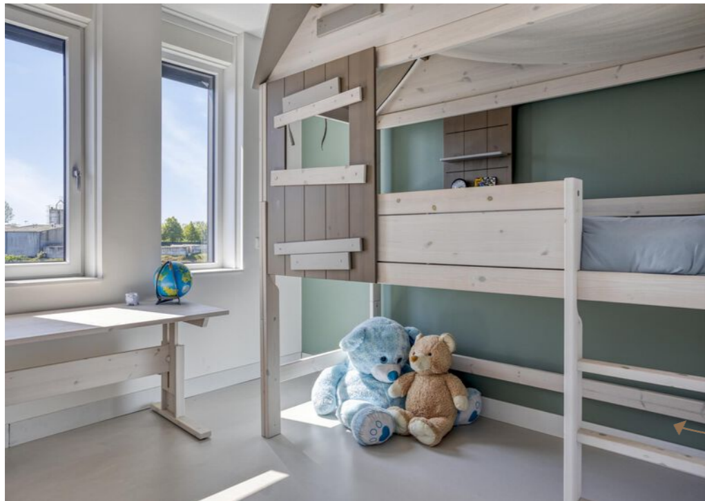
Totaal vier slaapkamers