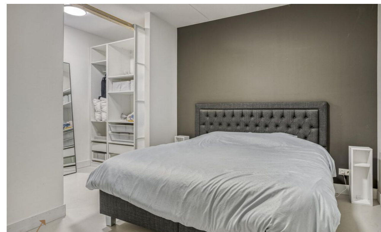
Slaapkamer met inloopkast