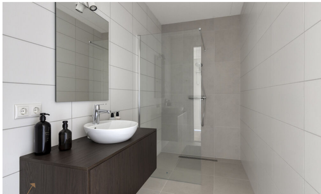
Badkamer ideaal voor gasten of logees