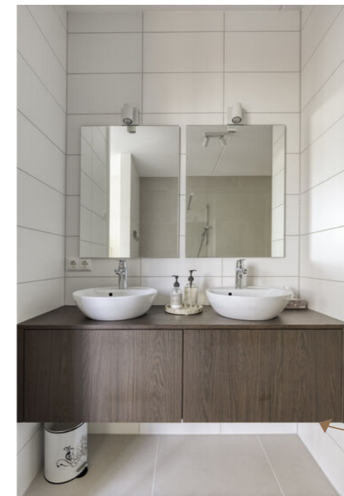
Luxe badkamer en-suite