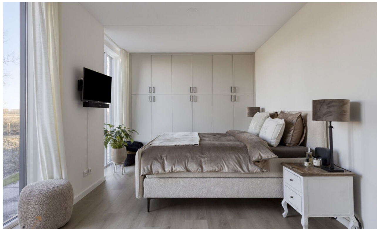
Royale hoofdslaapkamer met vaste kast