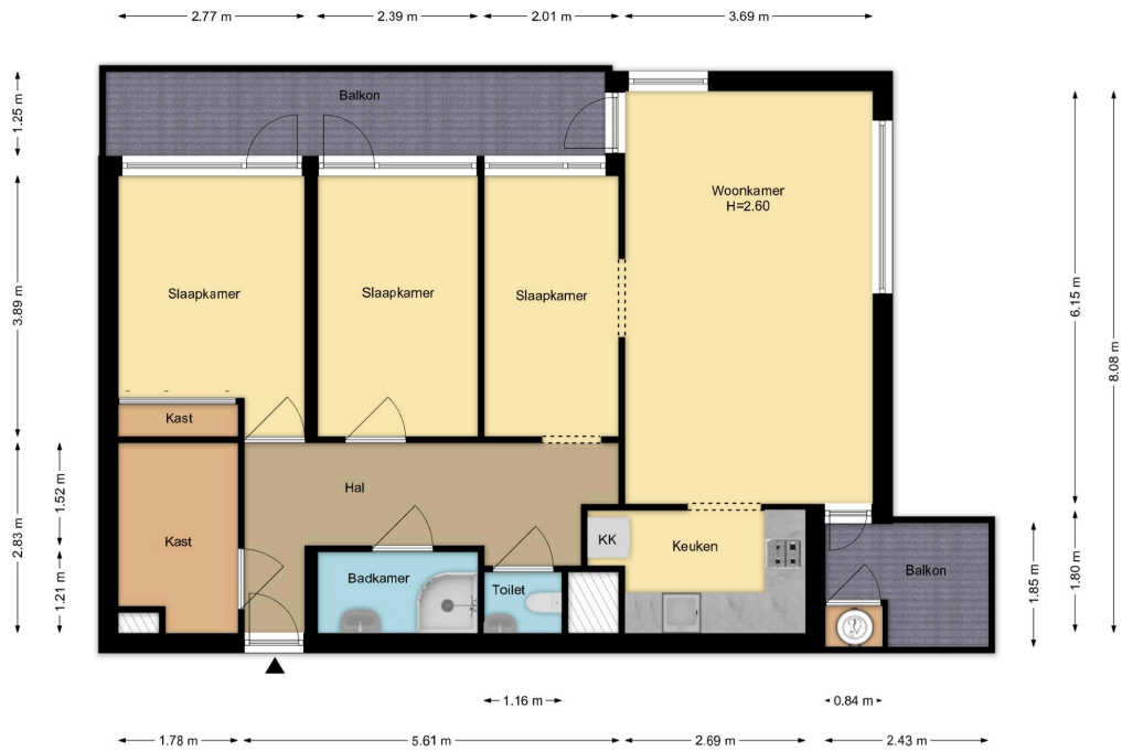
Appartement Schootlandstraat 294, Haarlem R.M. Vastgoedpresentatie. Aan deze plattegrond kunnen rechten worden ontleend