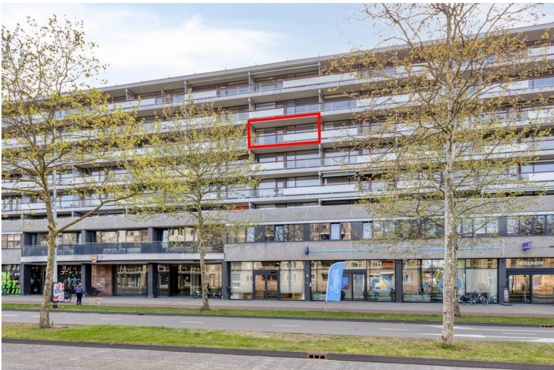
Bomanshof 127 te Eindhoven