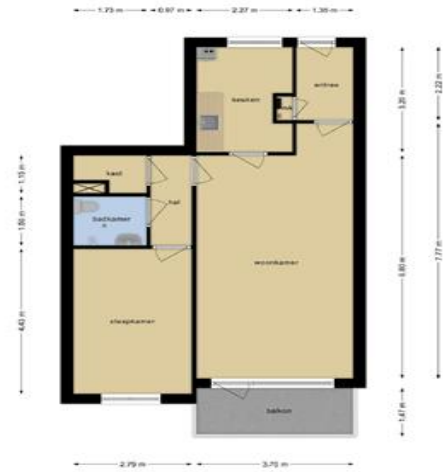
Deze plattegronden zijn opgemaakt voor indicatieve doeleinden. Hieraan kunnen geen rechten worden ontleend.