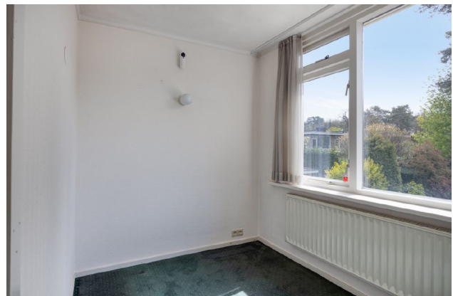
impressie slaap-/werkkamer 4