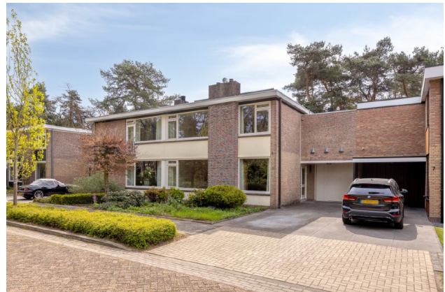
vooraanzicht met straatbeeld