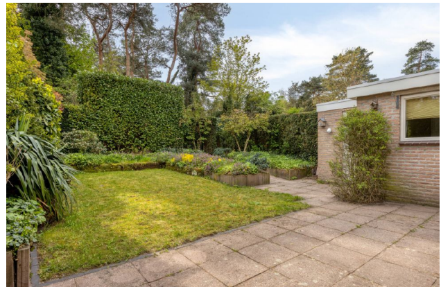
impressie achtertuin (zuid) met achterom