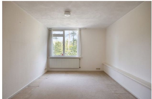
impressie slaapkamer 1