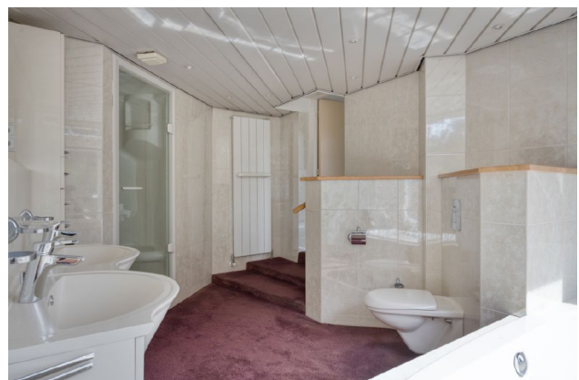
impressie complete badkamer