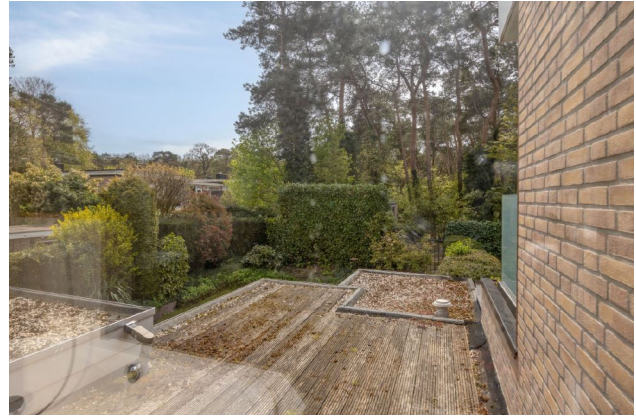
impressie uitzicht vanaf de 1 e verdieping