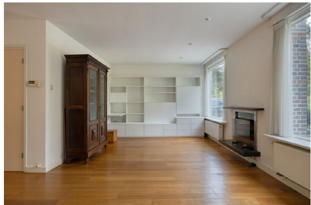
impressie living met volop lichtinval