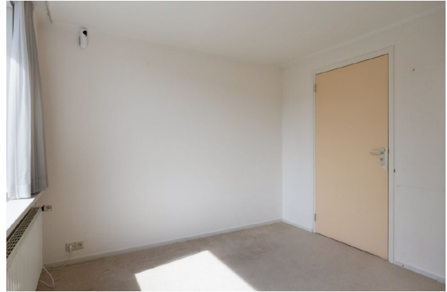
impressie slaapkamer 3