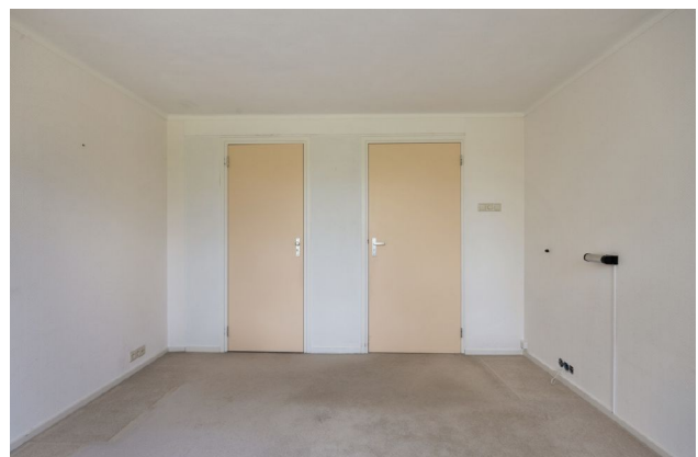
impressie slaapkamer 2 met inbouwkast