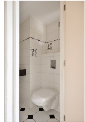
impressie ontvangthal met modern betegeld toilet