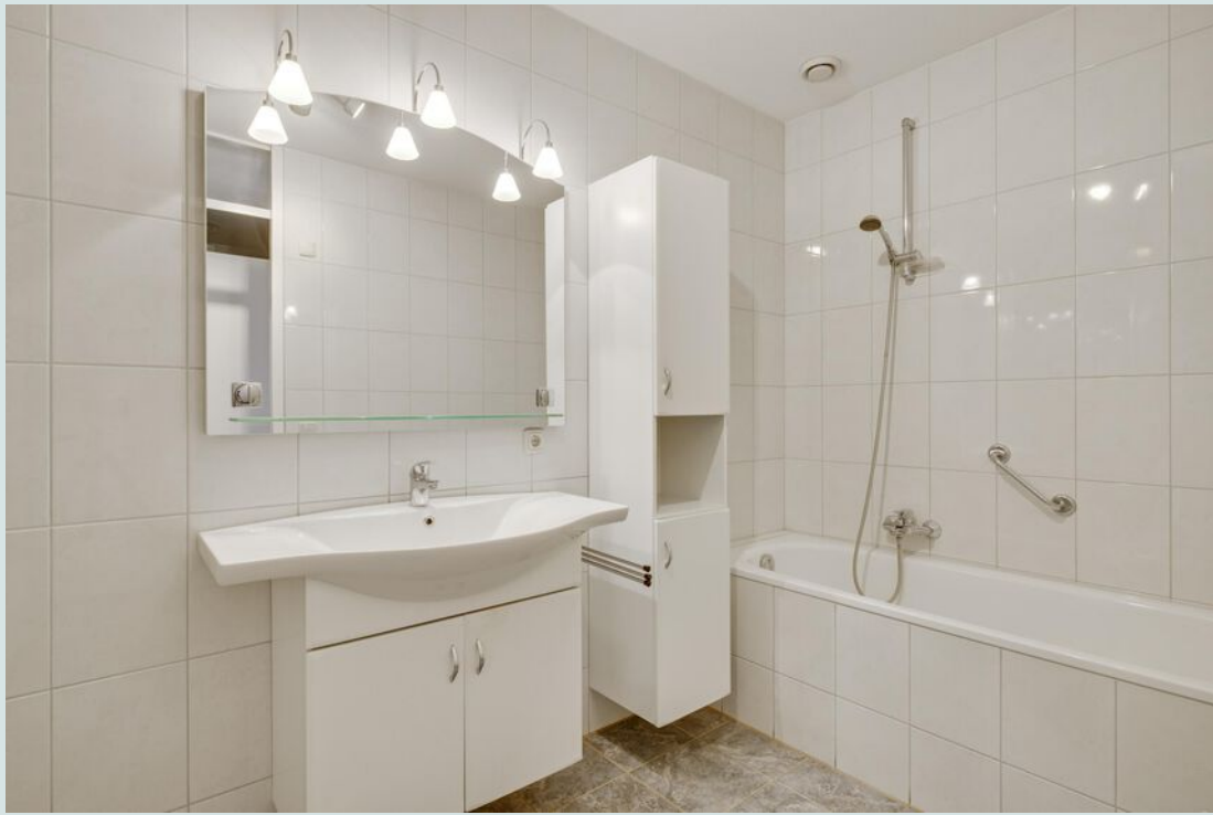
De badkamer is voorzien van een douche, ligbad en wastafel.