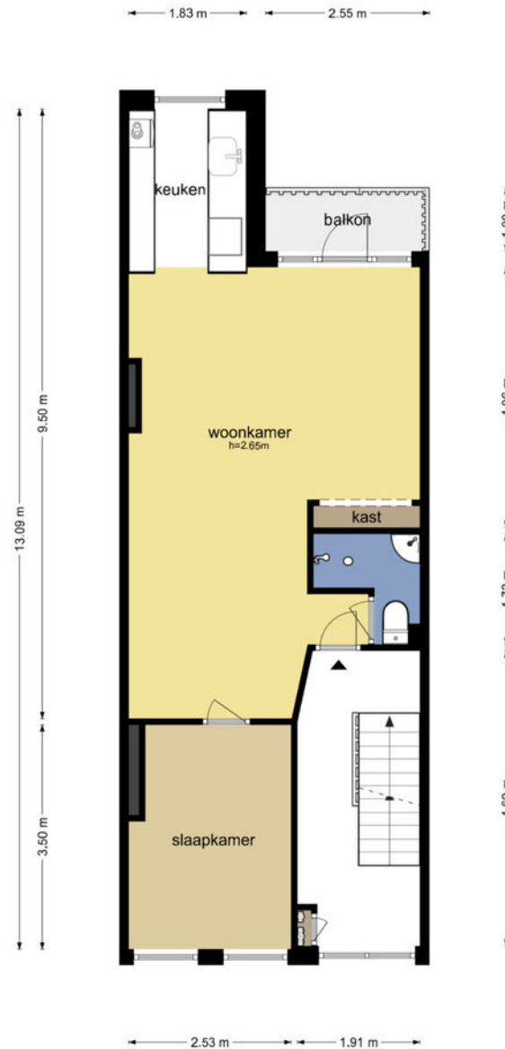
Tweede Schinkelstraat 9 III - Amsterdam Derde Verdieping