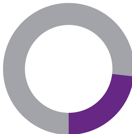
Koop / huur

0 - 14: 2% 15 - 24: 30% 25 - 44: 43% 45 - 64: 15% 65+: 11%