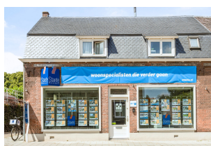
Sint-Michiëlsgestel Nieuwstraat 41a 073 - 551 00 50 infogestel@staete.nl