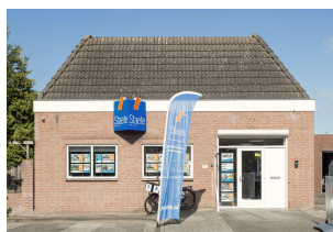
Drunen Achterstraat 14a 0416 - 376 141 infodrunen@staete.nl