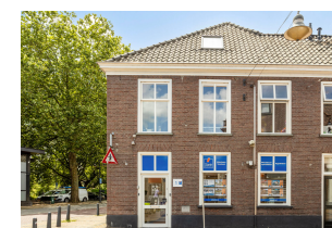
Boxtel Stationsstraat 1 0411 - 782 505 infoboxtel@staete.nl