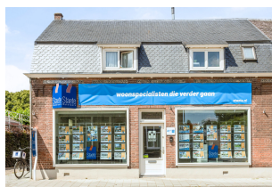
Sint-Michiëlsgestel Nieuwstraat 41a 073 - 551 00 50 infogestel@staete.nl