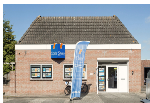
Drunen Achterstraat 14a 0416 - 376 141 infodrunen@staete.nl