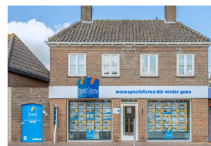
Vlijmen Plein 7a 073 - 511 70 00 infovlijmen@staete.nl