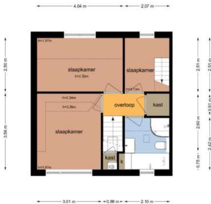
Van Nispenstraat 11 - Zevenaar Eerste Verdieping

De plattegronden zijn geproduceerd voor promotionele doeleinden en ter indicatie. Aan de plattegronden kunnen geen rechten worden ontleend.