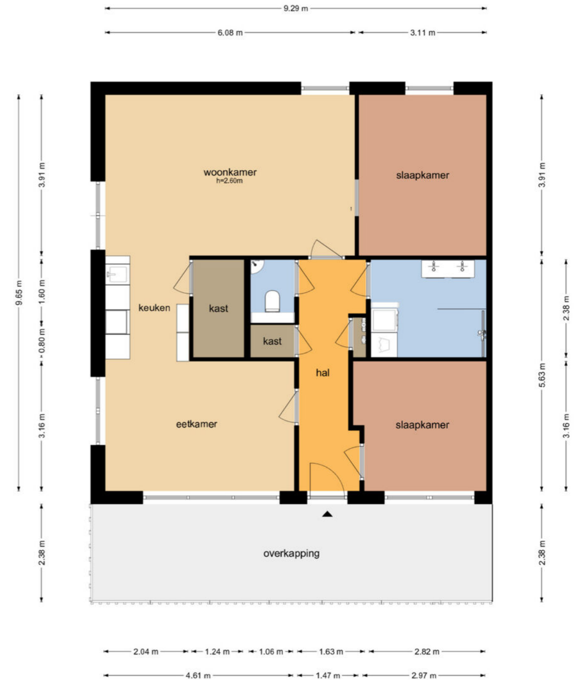
Laan van de Vrijheid 68 - Groningen Appartement

De plattegronden zijn geproduceerd voor promotionele doeleinden en ter indicatie. Aan de plattegronden kunnen geen rechten worden ontleend © www.objecten.nl