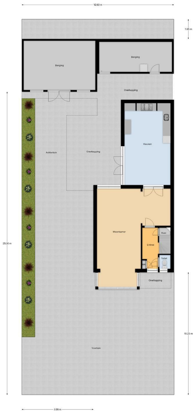
Begane Grond Tuin