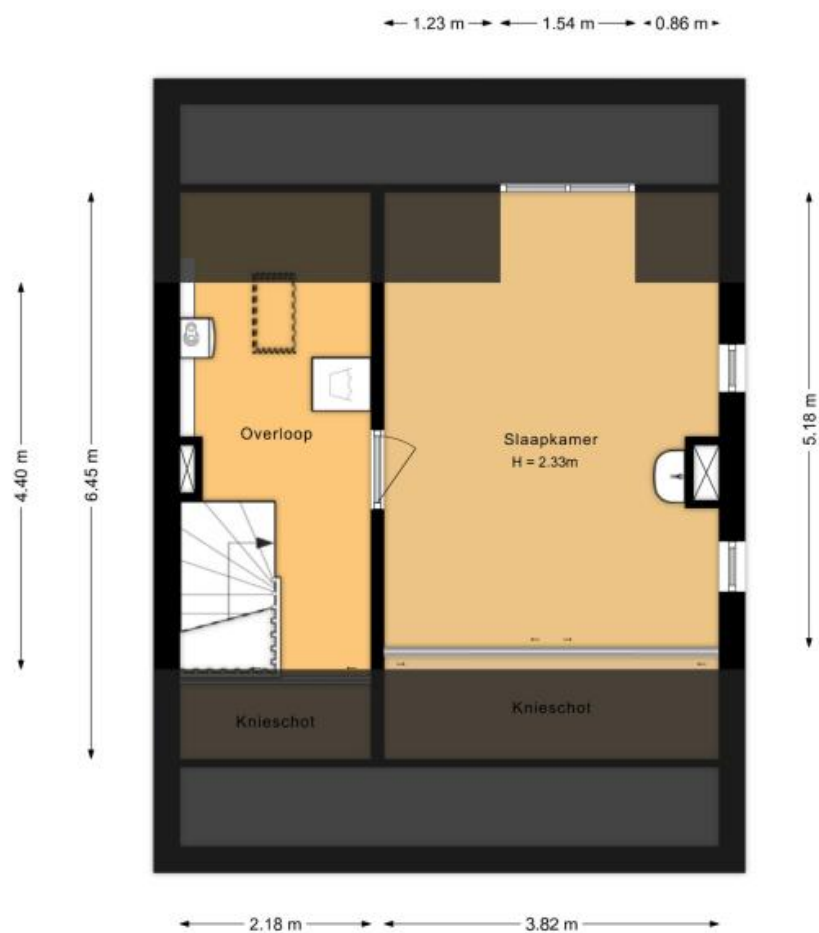
Tweede verdieping Hoogduinweg 56 De Zilk