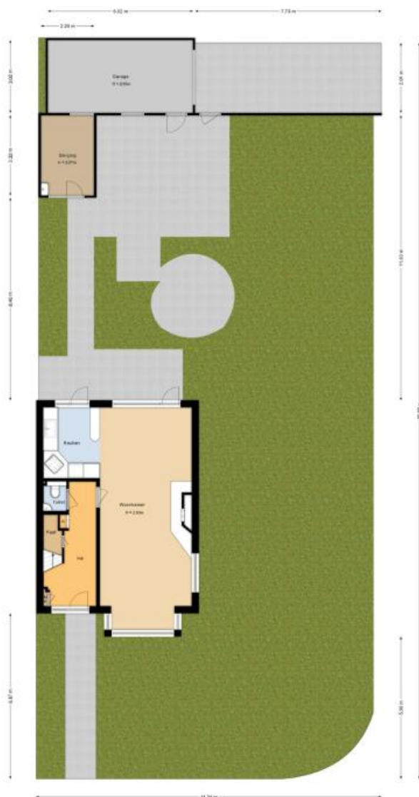
Situatie Hoogduinweg 56 De Zijk