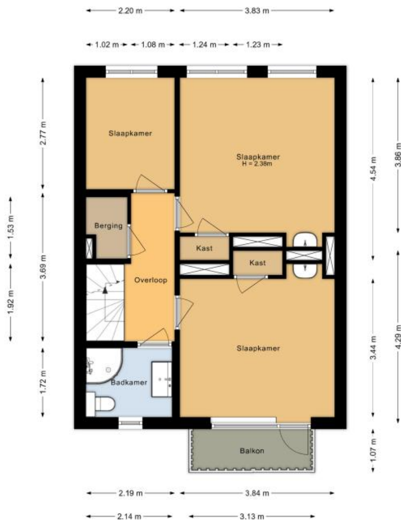
Eerste verdieping Hoogduinweg 56 De Zilk