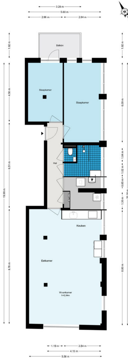
Patrimoniumlaan 28B - Veenendaal Appartement

De plattegronden zijn geproduceerd voor promotionele doeleinden en ter indicatie. Aan de plattegronden kunnen geen rechten worden ontleend.