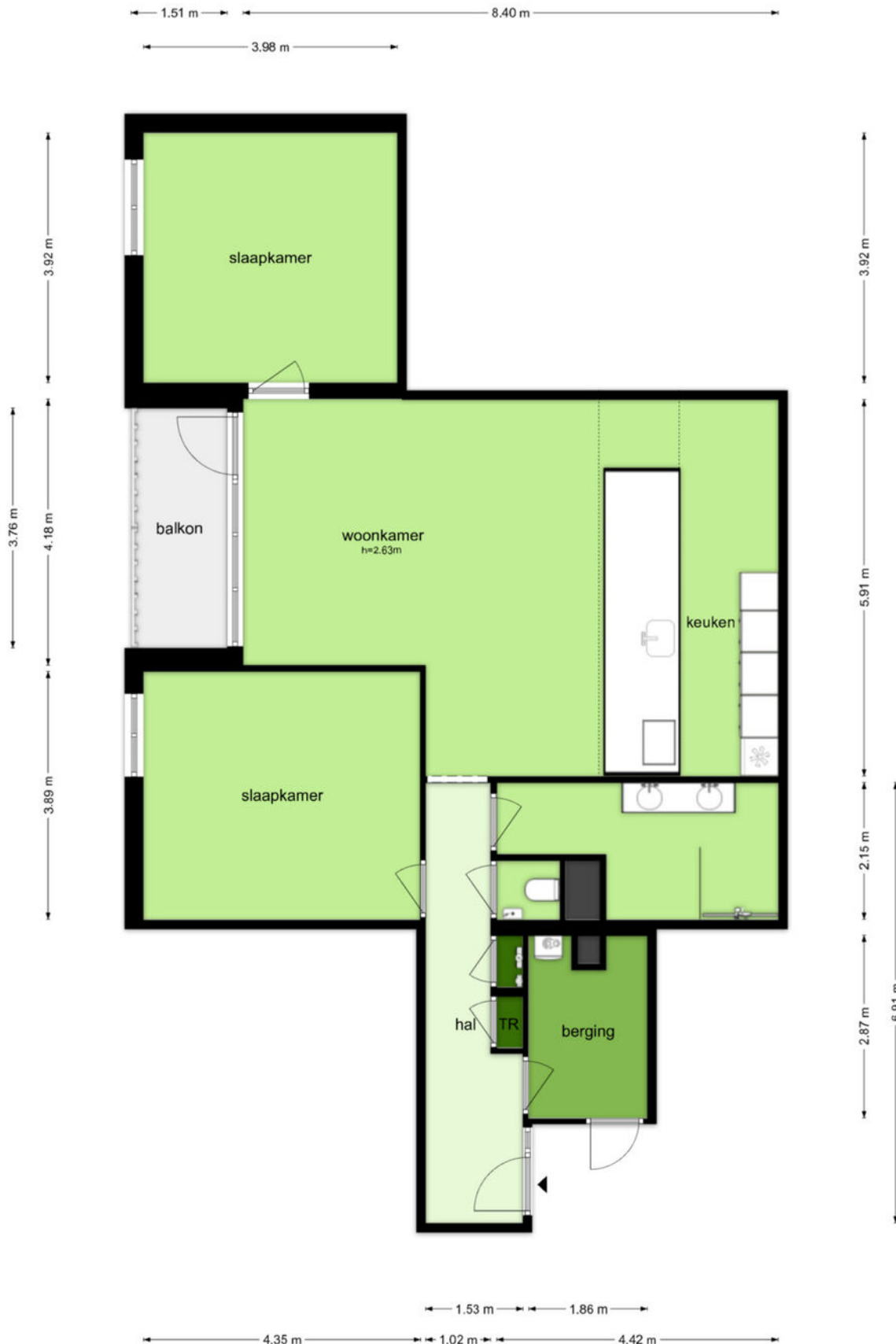
HOMERUSNOT Z3 - Aimere Appartement

De plattegronden zijn geproduceerd voor promotionele doeleinden en ter indicatie. Aan de plattegronden kunnen geen rechten worden ontleend.