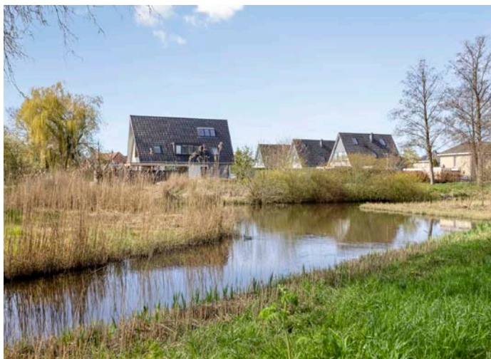
Aan de rand van het Purmerbos