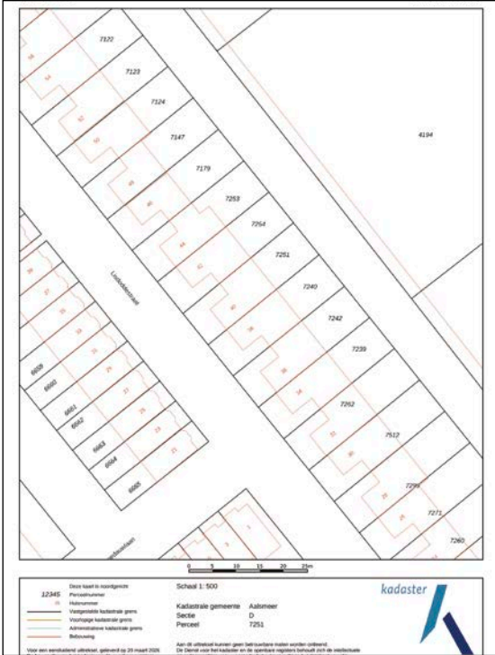
noorden kadastrale kaart

De Westeinderplassen bieden een scala aan recreatiemogelijkheden zoals zeilen, vissen en zwemmen, ideaal voor liefhebbers van watersport en natuur. Daarnaast is Kudelstaart een kindvriendelijke omgeving met diverse speelplekken, scholen en sportverenigingen.