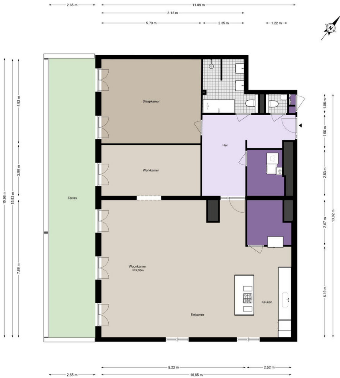
Jacob Burggraafstraat 214 - Amsterdam Appartement

De plattegronden zijn geproduceerd voor promotionele doeleinden en ter indicatie. Aan de plattegronden kunnen geen rechten worden ontleend.