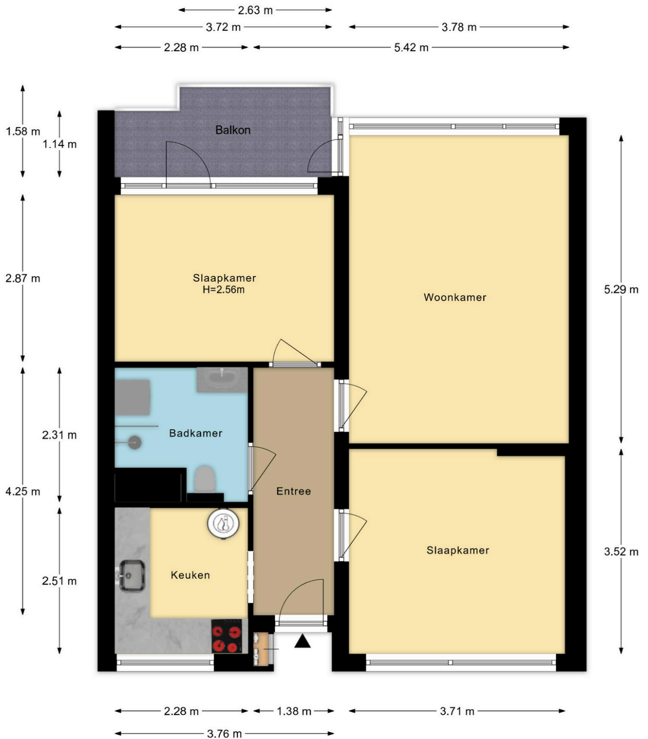
Ierlandstraat 138 Haarlem Appartement