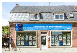
Sint-Michiëlsgestel Nieuwstraat 41a 073 - 551 00 50 infogestel@staete.nl