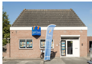
Drunen Achterstraat 14a 0416 - 376 141 infodrunen@staete.nl