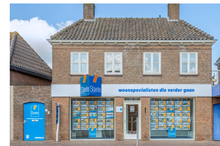
Vlijmen Plein 7a 073 - 511 70 00 infovlijmen@staete.nl