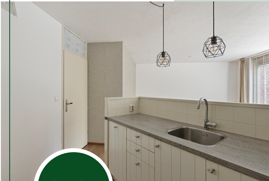
Keukeninrichting in hoekopstelling

De open keuken, met keukeninrichting in een hoekopstelling in een lichte kleurstelling, beschikt over veel kastruimte met geprofileerde witte deuren, soft-close lades en over een kunststof werkblad in betonlook met een spatwand van lichte keramische wandtegels en is voorzien van mechanische ventilatie.