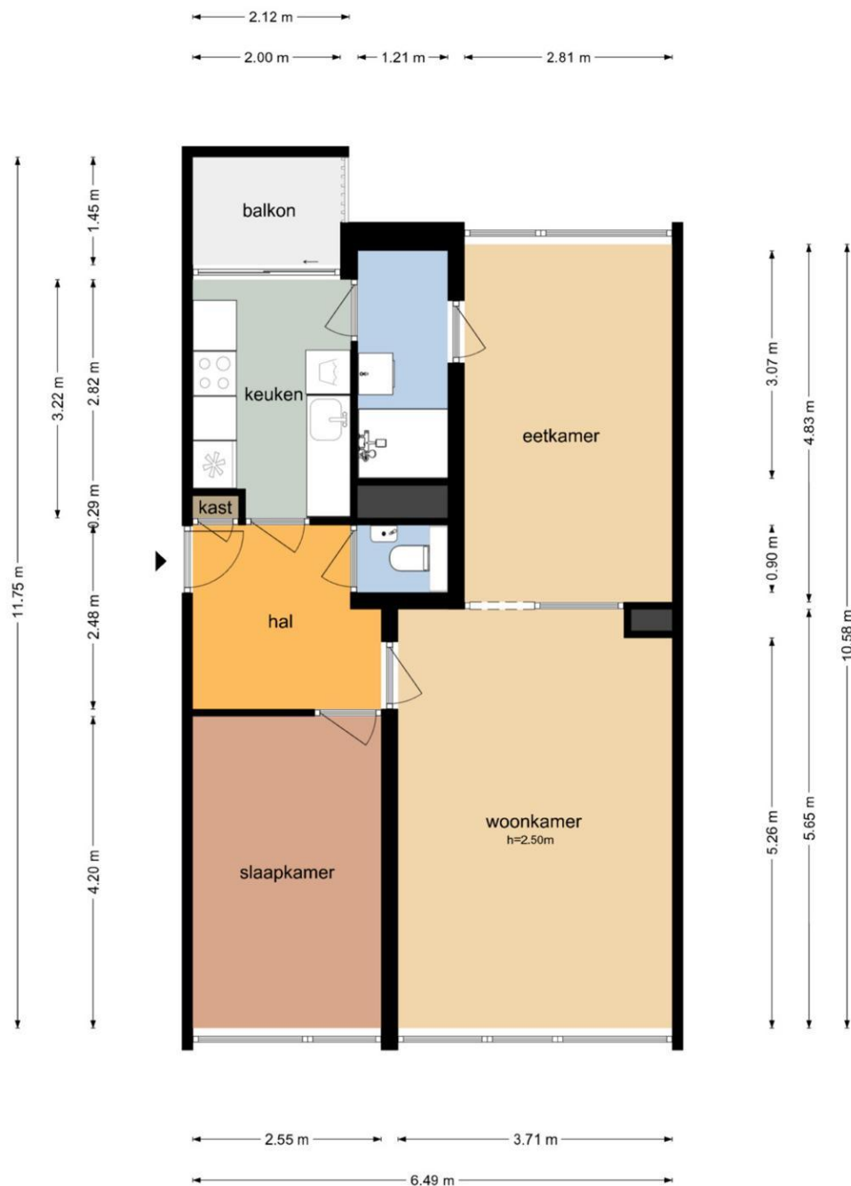
Kapteynlaan 147 - Utrecht Eerste Verdieping

De plattegronden zijn geproduceerd voor promotionele doeleinden en ter indicatie. Aan de plattegronden kunnen geen rechten worden ontleend © www.objectenco.nl