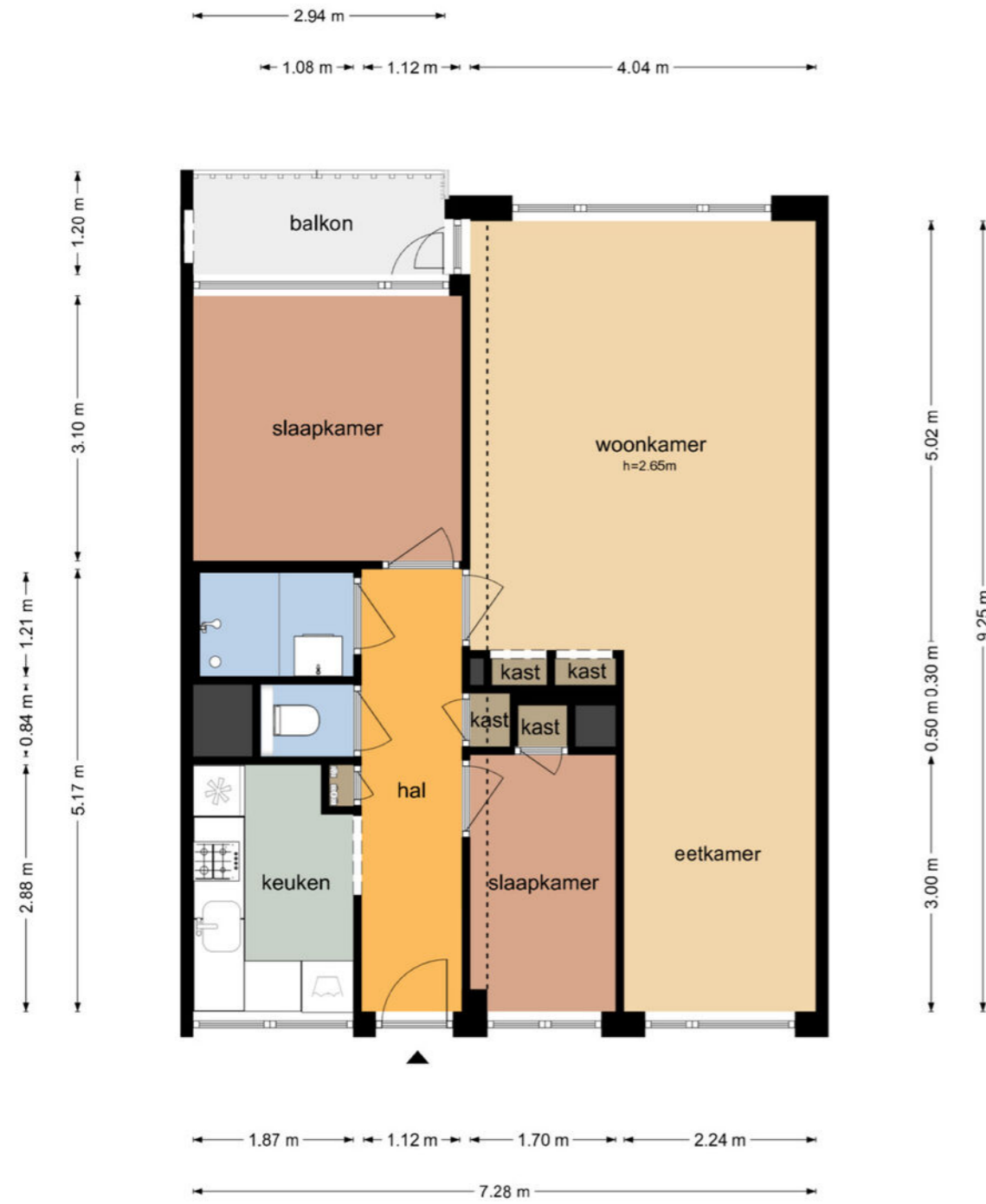
Eem 41 - Assen Appartement

De plattegronden zijn geproduceerd voor promotionele doeleinden en ter indicatie. Aan de plattegronden kunnen geen rechten worden ontleend