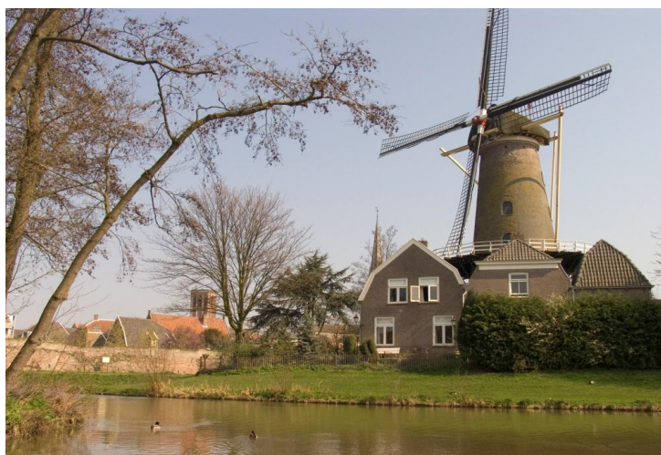
Molen 'de Hoop'

Ook is er een busverbinding naar Tiel, Vianen, Eck & Wiel en Leerdam.