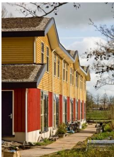
Ecologische wijk 'EVA Lanxmeer'

Maar het is ook goed toeven in de uiterwaarden van Culemborg. Culemborg ligt immers aan de Lek. U kunt hier heerlijk wandelen en fietsen.