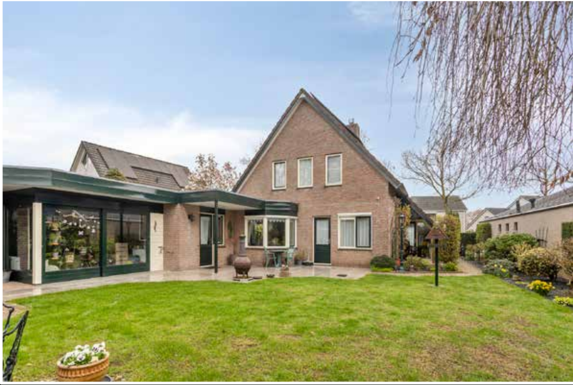
Eerbeek Kraaiheide 84