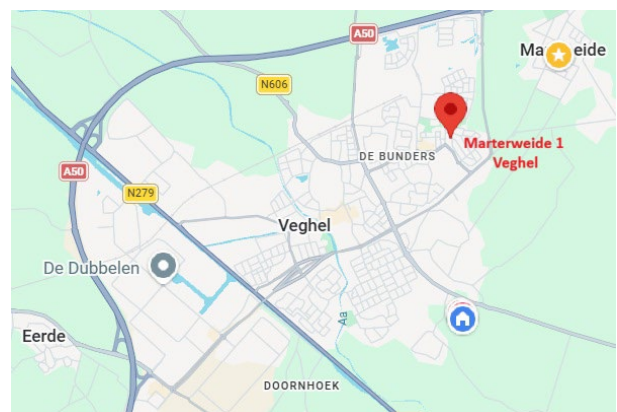
Plattegrond Google Maps