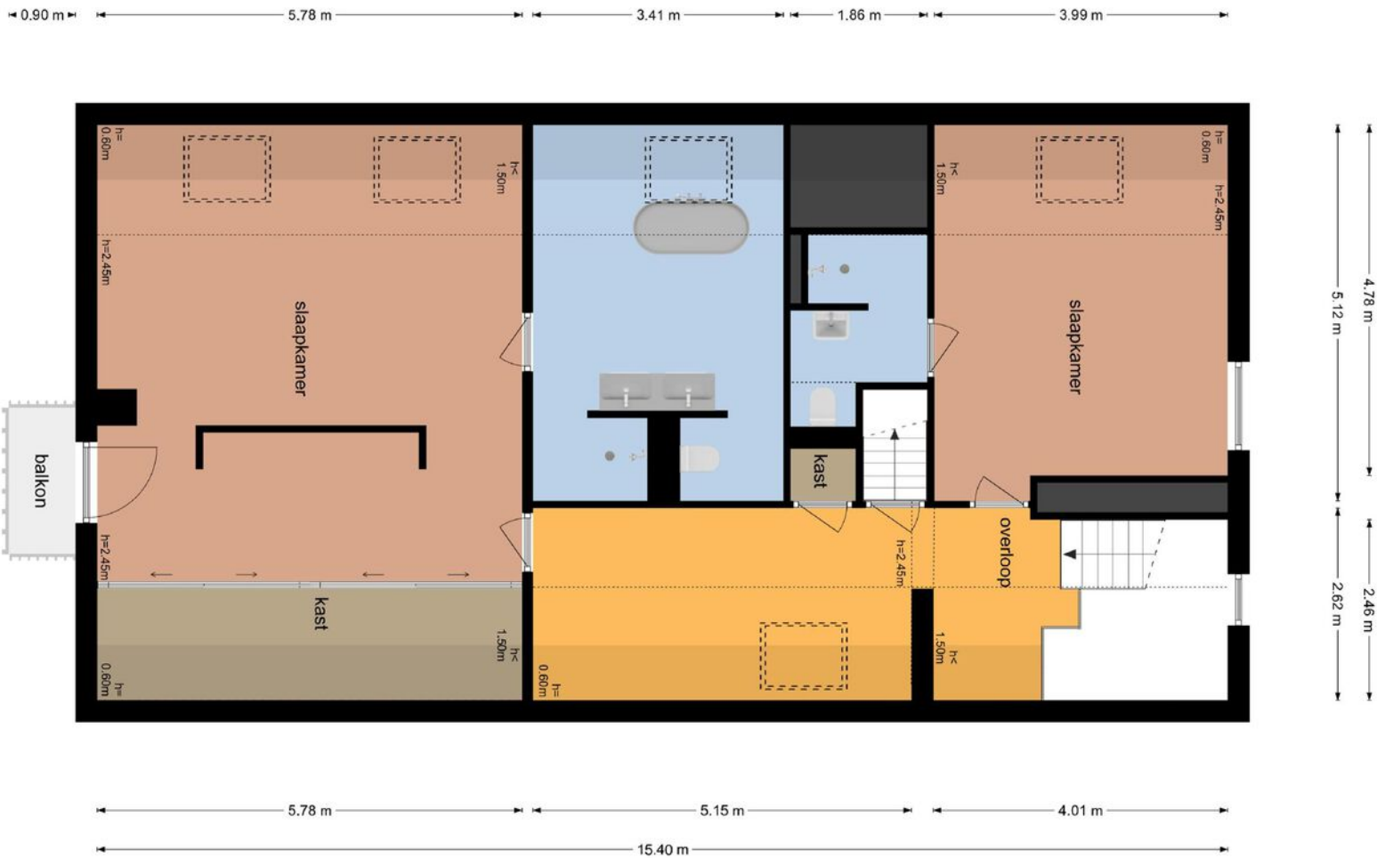
Achthoven 31 - Lexmond Eerste Verdieping

De plattegronden zijn geproduceerd voor promotionele doeleinden en ter indicatie. Aan de plattegronden kunnen geen rechten worden ontleend.