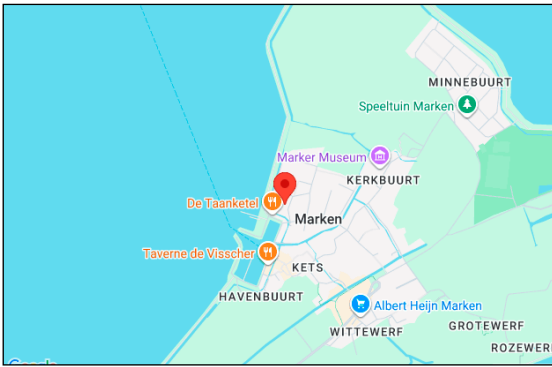
noorden kadastrale kaart