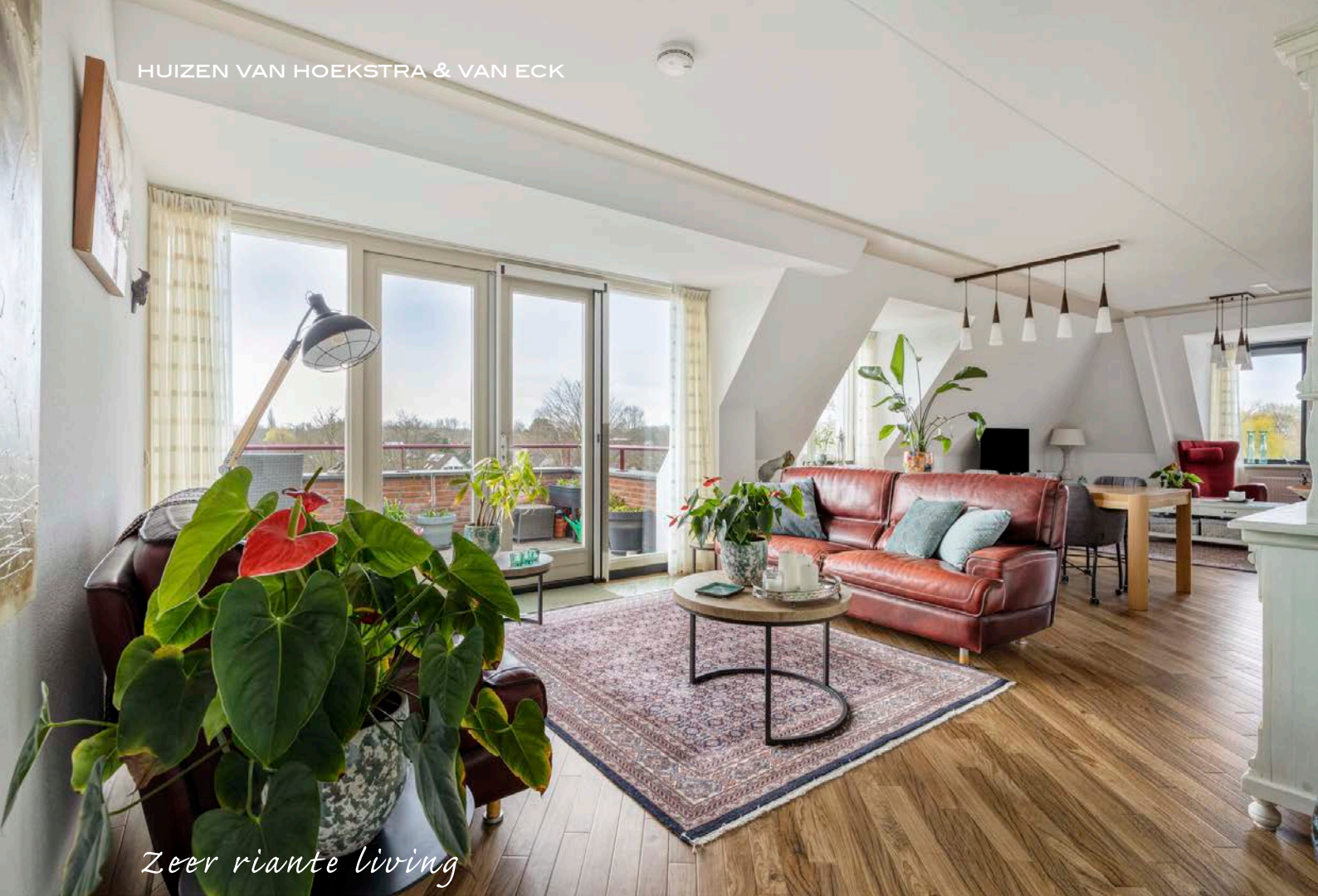
Zeer riante living