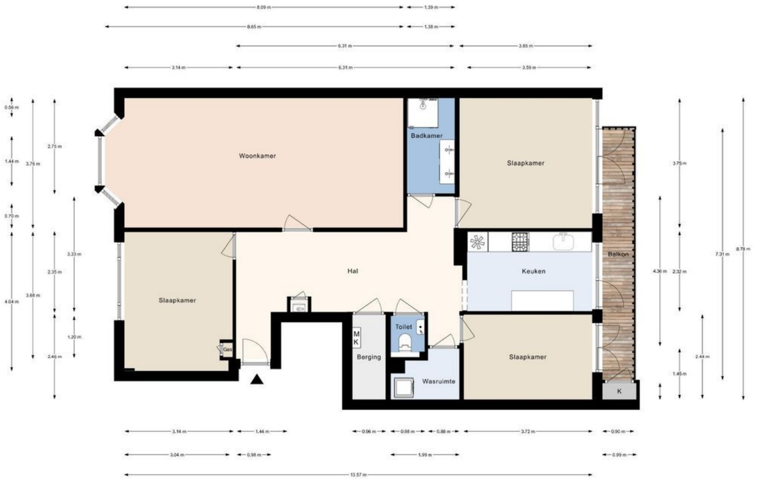
Lijsterbesplein 16, Den Haag | 1e verdieping H = 2.96 m